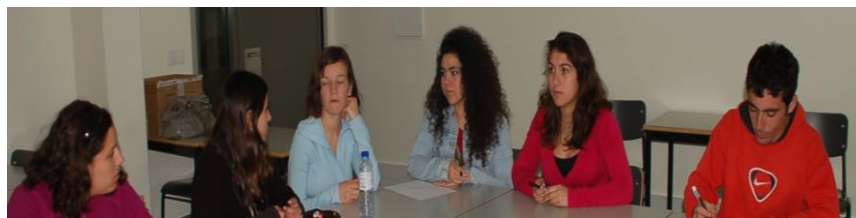
Alunos da turma do 2º D