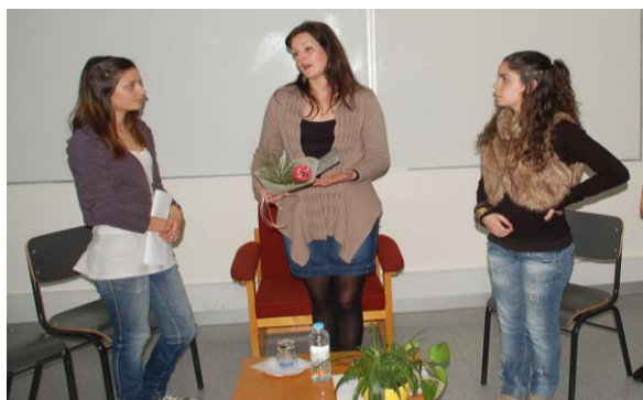
Agradecimento à animadora

J.: Agradecemos a sua disponibilidade e a sua preciosa colaboração nesta entrevista. Foi importante para a nossa formação pessoal e profissional. Felicidades e continuação de um bom trabalho.