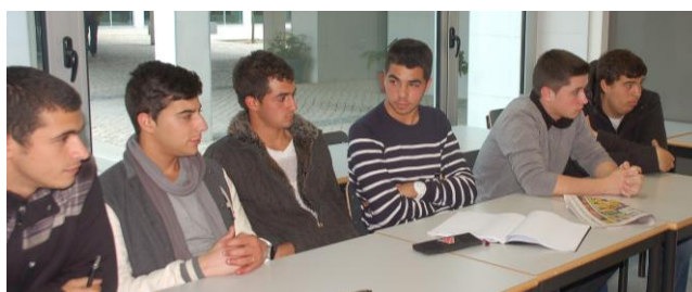
Alunos da turma do 2º F

A entrevista foi previamente elaborada pelos alunos da turma, durante uma das sessões do Projeto “Caminhando Juntos” organizadas pelo Serviço de Psicologia e Orientação da escola.